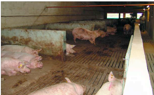
Parque y pasillo de servicio entre parques

La repentina libertad de movimientos de que gozan tras haber permanecido largo tiempo con una limitada movilidad repercute en su sistema muscular, no "entrenado" para la actividad. Es, por tanto, un aspecto a tener en cuenta en la adaptación de las cerdas adultas en las granjas en remodelación donde pudiera apreciarse una cierta apatía o inactividad de éstas en los primeros días de estar en parques.