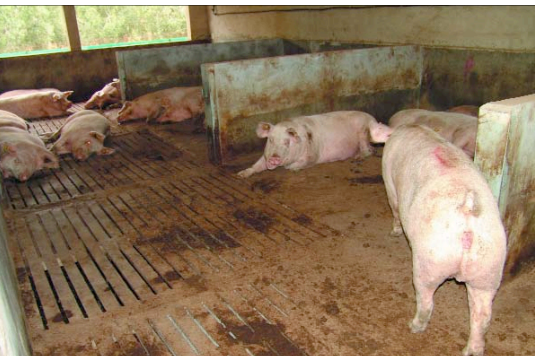
Zona de descanso