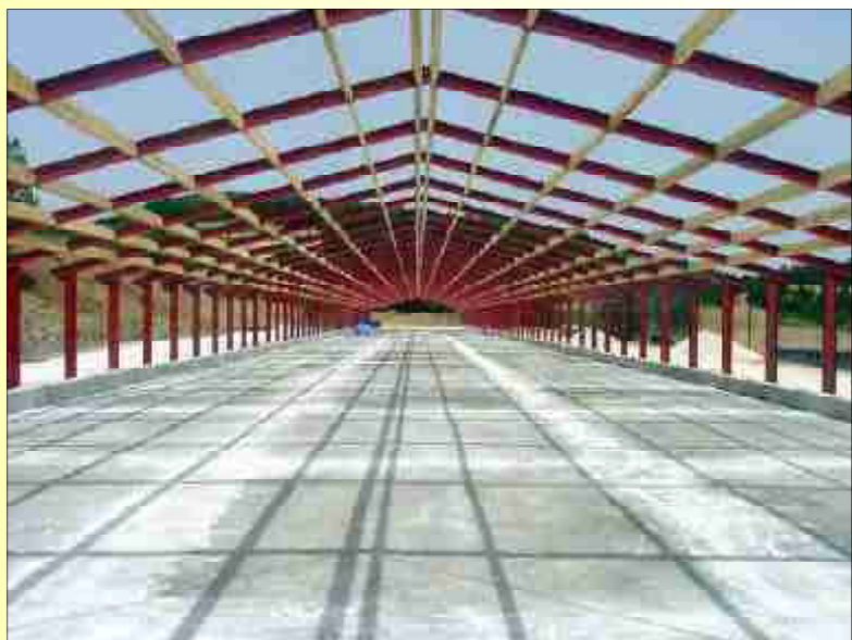
La nave, en fase de construcción.

cm y lo más interesante de ellas es el oscurecedor, un cajón especial diseñado por AGROGI, situado en el exterior y que se puede retirar pues se apoya simplemente sobre una barra metálica. En su interior tiene unas láminas de plástico ondulado por las que pasa el aire -éste aumenta algo la presión estática-, adaptándose a la verdadera trampilla, también de plástico, incorporada en el muro. En la parte interior va una pantalla individual, con forma ligeramente en «S», abisagrada por la parte inferior,