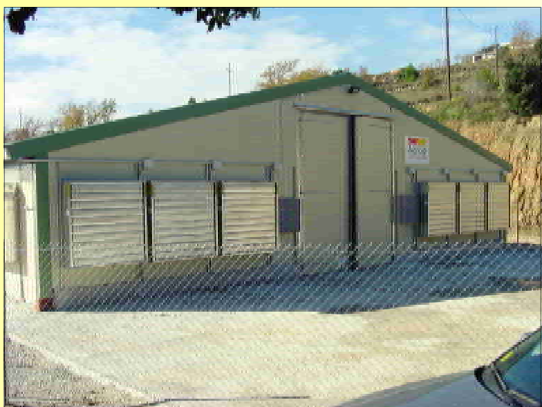
Extremo de la nave en el cual se hallan los extractores para la ventilación.

Para completar el control ambiental y proporcionar la calefacción necesaria a los pollitos se dispone de 2 aerotermos en la nave pequeña y 4 en