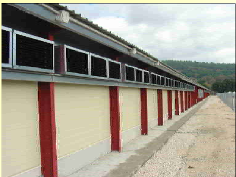
Detalle de los oscurecedores exteriores.

la grande, de 51.600 kcal/h cada uno, a gas propano, colocados a trasbolillo. En el exterior hay 2 grandes tanques de gas propano, para 8 m 3 cada uno.