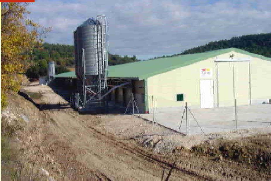
Vista general de la nave.

La dirección de la obra civil de la nave ha sido realizada por técnicos de la empresa AGROGI, de La Cellera de Ter, Girona, la cual se ha encargado asimismo de la instalación de ventilación, que es el aspecto más destacado de la nave. Es esta empresa, también, la que se ha responsabilizado de la entrega del proyecto «llaves en mano», incluyendo la complejidad actual de la legalización de la granja.